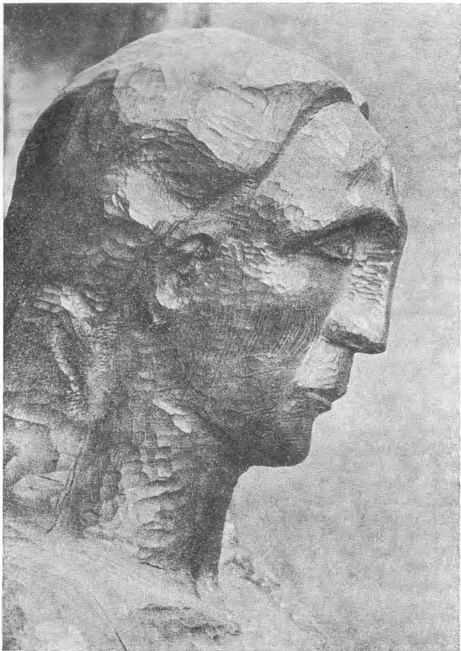
Mänsklighetsrepresentantens huvud i profil.