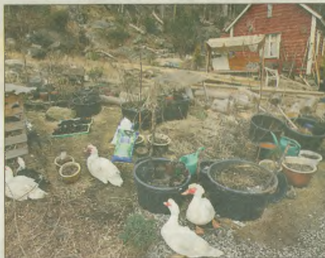
DYR OG PLANTER: Moskusender vandrer rundt blant bøtter med nyttevekster.