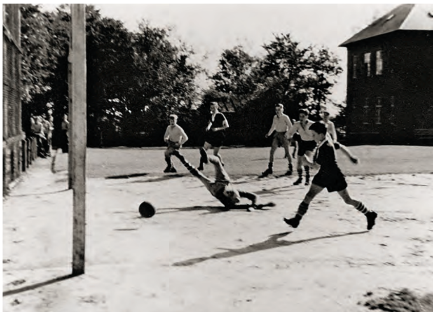
Dreng spiller fodbold på Godhavn. Foto: Johnny Viinblad Jensen 1963.

I interviewet fortæller deltageren, at han følte det som en straf, når han skulle op til psykiateren. Han er en af de 4 informanter, som føler sig udsat for seksuelle forulempelser hos psykiateren. Efter et flugtforsøg fik han at vide, at han skulle have nogle vitaminpiller, 1 om morgenen og 2 om aftenen. Det stod på i et år, og han røg han af førsteholdet i fodbold i Tisvilde. Han mener, at der var en sammenhæng mellem de tre begivenheder: flugten, pillerne og den svigtende evne til fodboldspillet.