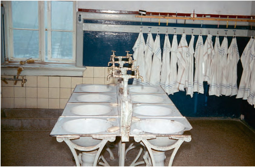
Badeværelset i tilknytning til sovesalen. Ved de 8 vaske skulle drengene etagevaske sig morgen og aften. Foto: lærer Henning Clausen 1968.

der forøvede overgrebene, holdt op. F1957-59 husker, at to navngivne ældre drenge udnyttede den mindste dreng på Godhavn seksuelt. Det foregik bl.a. i badet. Han siger, efter at have tænkt over det: “Jeg tror ikke, han tog skade.” V1963-65 fortæller, at nogle af drengene blev hevet ud på badeværelset af de store drenge om natten, “Det var et tagselvbord, og det skete ofte.” Man kunne høre skrig og tumult derudefra. De hvide underbukser var røde af blod den næste morgen, og så viste man, hvad der var sket. Mens V1963-65 fortæller om dette, får han pludselig en voldsom hovedpine. Han slutter: “Nu kan jeg huske episoderne. Men de skal ned i posen igen. Jeg vil ikke drømme om dem om natten.”