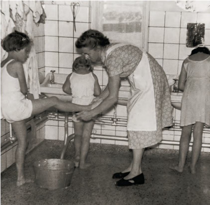
En gruppe piger bliver etagevasket på børnehjemmet Vejle Fjord. Ud over at komme i bad en gang om ugen fik børnene dagligt vasket ansigt, hænder og fødder med sæbe og vaskeklud. ca. 1955.