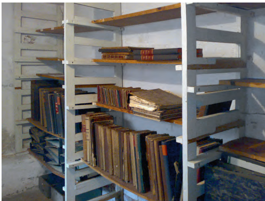
En del af arkivalierne fra Godhavns lange virke opbevares stadig på Godhavn. Her ses nogle af de protokoller, som opbevares i kælderen under køkkenet på døgninstitutionen.