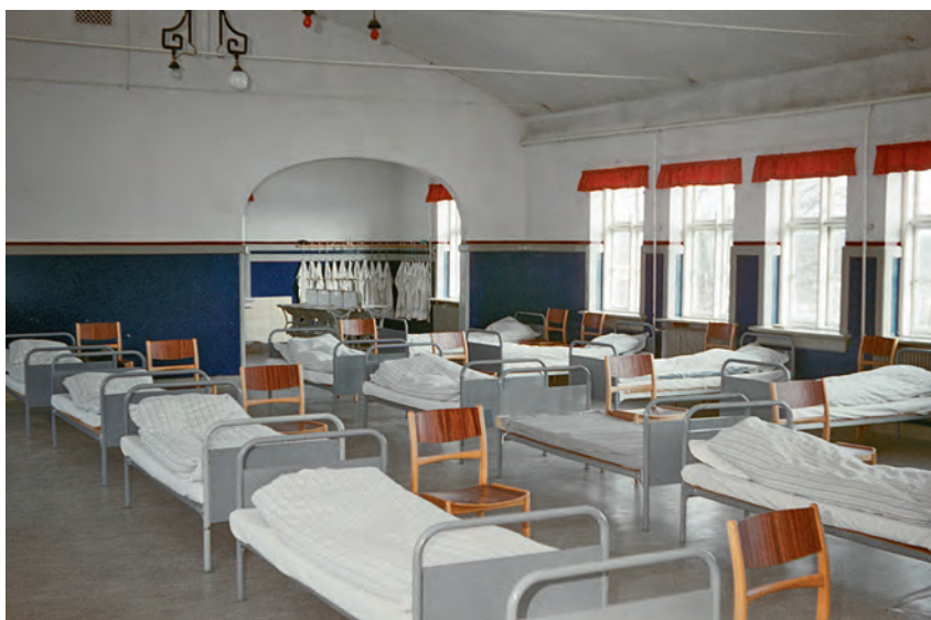
Udsnit af sovesalen på Godhavn. Drengenes vaskerum ses bagerst i billedet. Foto: lærer Henning Clausen 1968.

ved siden af sovesalen og havde plads til 5-6 senge. Sovesal og Blåtårn befandt sig på første sal, og brandtrappen til sovesalen befandt sig under en lem i Blåtårns gulv. Da flugtforsøg ofte skete via brandtrappen, led drengen i sengen oven på lemmen dobbelt. Det var forbudt blandt drengene at sladre til lærerne og svært at påstå, at man intet havde hørt, når ens seng først skulle flyttes, for at en dreng kunne flygte. Når en dreng havde tisset i sengen, skulle han selv vaske sengetøjet, mens han andre gange kunne nøjes med at aflevere det i vaskeriet. Nogle få beretter, at de i en periode blev tvunget til at stå med lagnerne udenfor, til de var tørret i luften. W1964-66 husker, at han, når han var ked af det om dagen, tænkte “at man havde et frirum, når man kom i seng.” Men når man så kom i seng, “så lå man og frygtede, at man tissede i sengen. Når man så vågnede om morgenen, blev man udstillet.” Den vagthavende lærer vækkede først drengene i Blåtårn, “de, som så havde tisset i sengen, blev hevet op af sengen og råbt og skreget af.” Alt