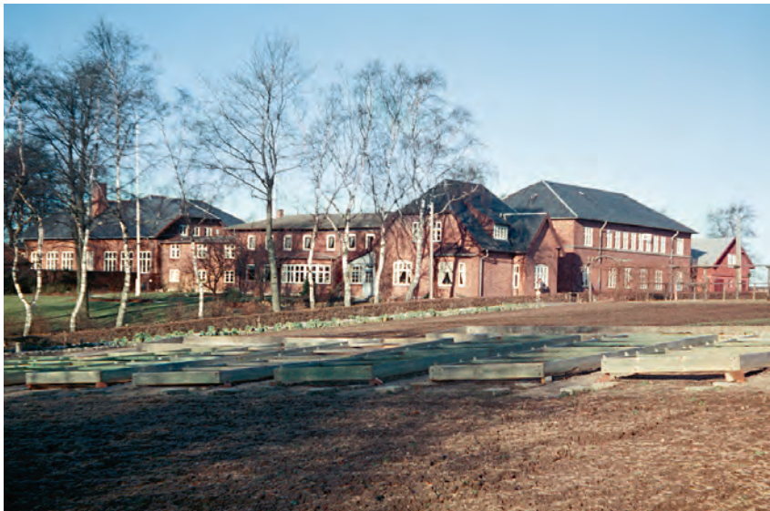
Godhavnskomplekset med forstanderbolig, gymnastiksal, sovesal, skolestuer, maler- og snedkerværksteder.