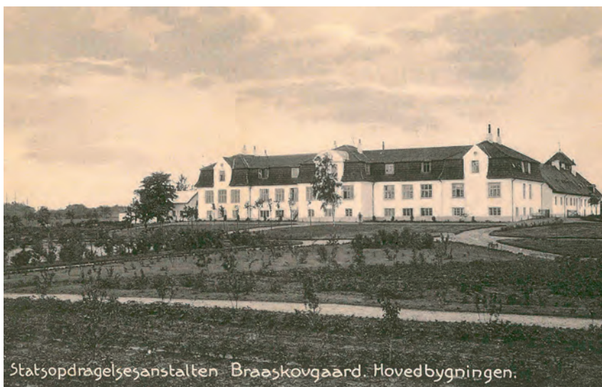
Bråskovgård fotograferet omkring 1915. Bygningen har ikke ændret udseende og fungerer i dag som efterskole.

en tur på den lukkede afdeling på Sundholm. Da han ankom til Bråskovgård, blev han indsat i den lukkede specialafdeling: “Det var små bitte celler, de var ikke meget større 2 x 3 meter. Så var der et lille vindue oppe foroven. Tremmerne var formet ligesom vinduerne, sådan nogle små firkanter (panserglas MR). Man gik ind og satte sig på sin pind, for det gjorde man også i spjældet. Der var ikke nogen beskæftigelse, andet end at man kunne komme nedenunder og rense malingen af postkasser, kan jeg huske, på et værksted nedenunder, ellers var der ikke noget.” Her tilbragte han 14 dage, for så at blive overflyttet til den åbne afdeling, som dog ikke var mere åben, end at dørene blev låst om natten. Hans klagepunkter på Bråskovgård er: “Det hele var (han fløjter) helt firkantet. Kæft, trit og retning.” Bråskovgård fungerede ifølge ham som “et opbevaringssted, hvor der kun var enkelte og få medarbejdere, der havde empati.”