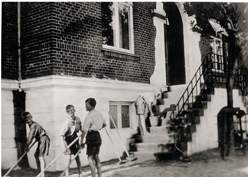
Fire drenge river og vasker trappe ved hovedindgangen til Landerupgaard. Fotograf ukendt, ca. 1950.

B: mand f. 1951 anbragt på Landerupgård 1960-65