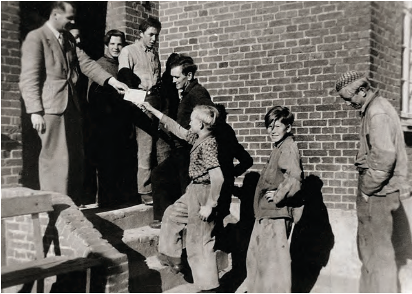
Dette opstillede og sjældne motiv af drenge i kø for at modtage brev hjemmefra stammer fra Seden Enggård på Fyn, som modtog drenge fra København. Fotograf ukendt, ca. 1960.

at besøge barnet.” 11 Fra 1966 kunne forstanderen ikke længere begrænse børnenes samkvem med forældre og familie, og brevcensuren blev afskaffet i et cirkulære gældende fra 1967, hvorefter man kun undtagelsesvis måtte åbne indgående breve og kun med elevens samtykke og tilstedeværelse. Hvis eleven nægtede, at brevet blev åbnet, kunne det tilbagesendes til afsenderen med en oplysende følgeskrivelse.