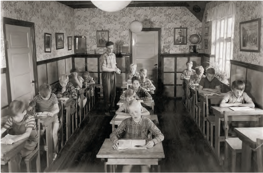
Den interne skole på Toftegård Drengeshjem 1960. Hjemmet var privatejet og havde plads til 25 drenge fra 02-14 år.

men, fulgt op af korte kurser på Hindholm Højskole. For spædbørnehjemmenes vedkommende (og vuggestuernes) indførtes en 3-årig uddannelse som statsautoriseret barneplejerske i 1951 som supplement til den 1-årige uddannelse som barneplejerske. Fra midten af 1950'erne blev barneplejerskeuddannelsen mere pædagogisk orienteret med teoretisk undervisning i "pædagogik, børnepsykologi, samfundslære mv." 23 En formel pædagogisk uddannelse for medarbejdere på børne- og ungdomshjem indførtes i 1960, med en 2-årig forsøgsuddannelse på Jægerspris Børneforsorgsseminarium. Denne uddannelse optog nye unge studerende, og ikke som på de tidligere kurser kun medarbejdere, som allerede var ansat i børneforsorgen. I 1964 fik stillingen som børneforsorgspædagog formel status. Herefter gik det stærkt. Frem til 1971 oprettedes 8 nye børneforsorgsseminarier i Danmark, hvor nye studerende kunne få en 3-årig pædagogisk uddannelse. I 1974 opret-