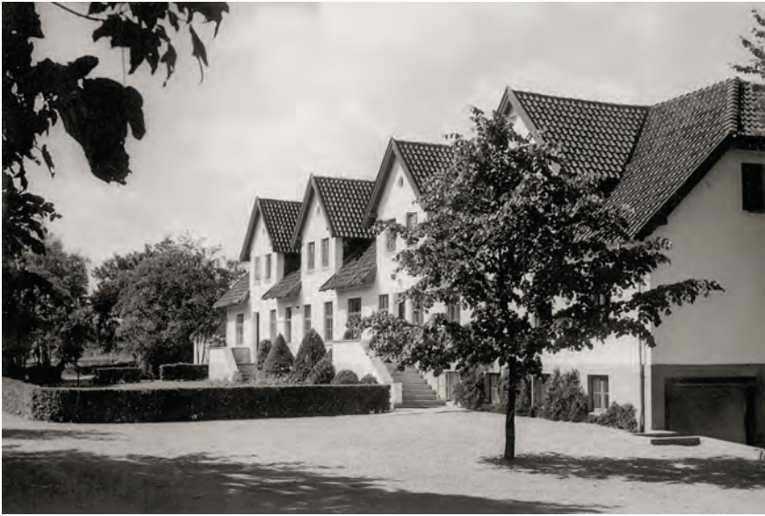
Toftegård Drengeshjem ca. 1960.

dårligt stå.” A1959-63 fortæller, at “han havde sådan en Ronson-lighter. Så skulle vi gå i s kole, og så fik vi sådan en Ronson-lighter i ryggen.” B1960-64 fortæller også om Ronson-lighteren: “Plejefar havde et trick med at slå med en lighter i hovedet på én, og det gjorde fand’me ondt.” Mens D1957-63 kan huske, at plejefar altid slog med sin jernlighter, engang blev han ved med at slå, til “jeg græd og skreg (...) han var ikke noget godt menneske.” Han fortæller, at forstanderen også kunne give lussinger og slå med knytnæver, hvis han var blevet rigtigt hidsig. D fortæller, at han var en af de drenge, plejefar altid var efter. A fortæller om aftenritualet på sovesalen, at drengene “skulle stå på sådan en lang række ned ad en gang,” og så kom forstanderparret og sagde godnat til drengene. Men “alle dem, der ikke troede på Gud, blev lagt op hans knæ, og så fik de en røvfuld. Det fik jeg hver dag (...) Jeg var ikke Guds barn.”