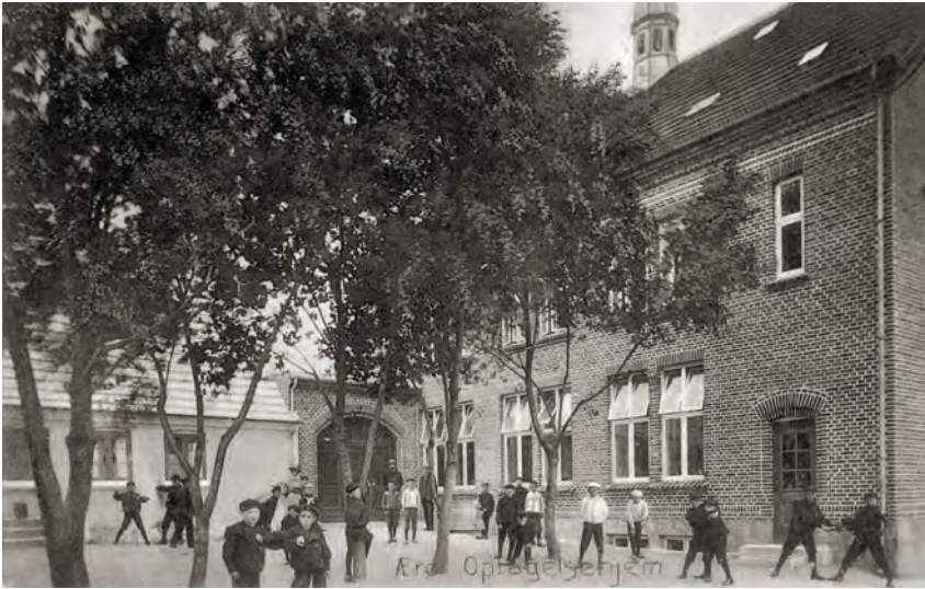
Ærø Iagttagelseshjem ca. 1925, hvor det hed Ærø Optagelseshjem.

kesholm og Børnehjemmet Kildebjerget (sidstnævnte kun tilknyttet foreningen). Deltager var: