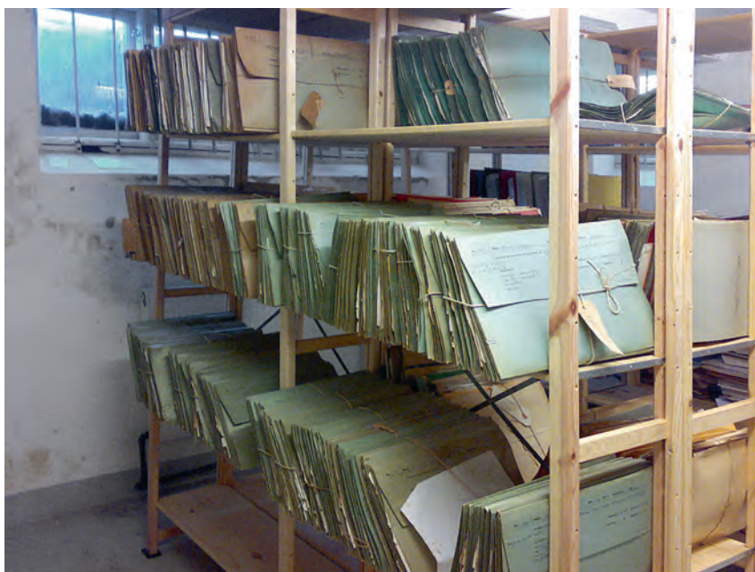
Hylder med elevjournaler på Godhavnsdrene. Arkivet på Godhavn.

Alt var gennemsyret af forstanderen, og der lå en dyne over stedet, som en ond ånd. Det får L1960'erne til at konkludere: “Vi var der for at blive hjulpet. Det var det, der var formålet med det, skulle man mene. Men det var stik modsat.” Der skal selvfølgelig være regler og konsekvenser på et børnehjem, men der skal ingen vold være, siger Æ1969-70. “Man kan ødelægge et menneske med vold.” Han kender mange, der efter Godhavn er gået i hundene. E1955-57 kunne godt ønske, at man skruede ned for alle tævene og i stedet gav børnene noget mere fritid. J1959-60 har savnet nogle voksne, der kunne sætte sig ind i, hvad drengene bar på, nogen, der forstod dem. Et forstanderpar burde være mennesker, som var interesserede i børn, siger P1961-63, så ville børnene føle tryk- hed og vide, at de havde nogen at gå til. “Forstanderparret burde jo have været reserveforældre, når vi nu ikke havde nogen,” siger han og fortsætter “Man skal helst ikke sende børn på børnehjem.” De børn på