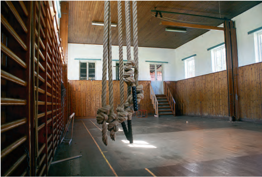
Gymnastiksalen på Værebros Drengeskole, som den ser ud i dag, 30 år efter nedlæggelsen.

reridt måske ville ophøre, hvis han blev konfronteret med stedet igen. Det viste sig, at den nye ejer havde bevaret gymnastiksalen med hest, plint og buk. “Da jeg kom ind i gymnastiksalen, kunne jeg høre stemmer (...) Jeg tænkte: “Hold kæft, hvordan er det, du reagerer?” Jeg kunne høre, hvordan de skreg. Jeg kunne huske, da vi fik af det der forbandede tovværk.” Forstanderens afstraffelser var foregået i gymnastiksalen, hvor den skyldige skulle stå bøjet over hesten (gymnastikredskab), mens forstanderen slog med et reb, som han holdt sammenfoldet i hånden. Han slog så hårdt, at der kom blodstænk på hesten, fortalte informanten.