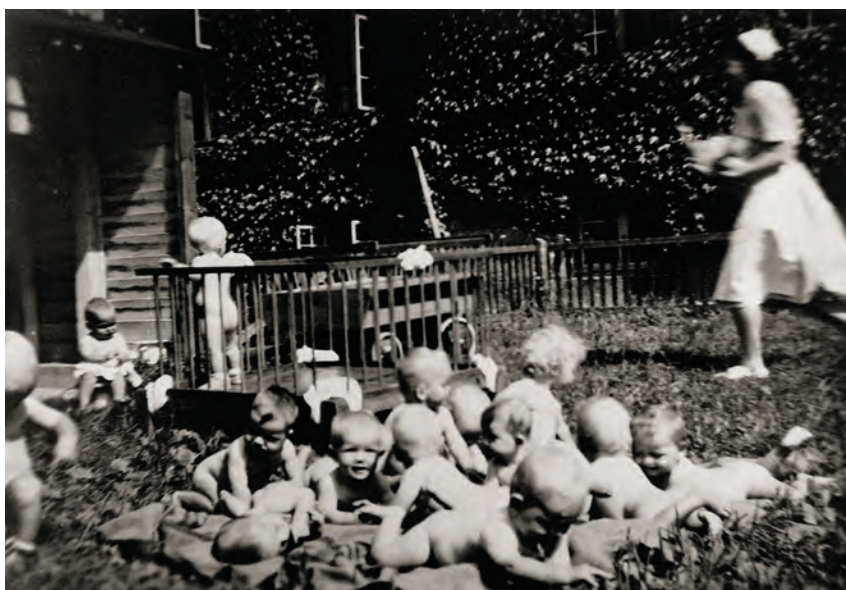
Der skulle løbes stærkt, når så mange spæde børn var ude i det fri for at få sol på kroppen. Billedet stammer fra Nislevgård spædbørnehjem på Fyn i 1952.

Mødre- og svangrehjemmene kunne enten ligge i forbindelse med et optagelseshjem for spædbørn eller med et spædbørnehjem. Mødrehjemmene var for unge, ugifte mødre mellem 14 og 18 år samt deres