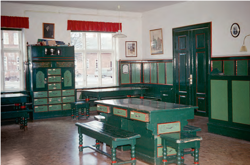
Drengenes dagligstue, som den så ud i hele undersøgelsesperioden frem til 1976. I højre side ses bagsiden af stueorglet, som frem til 1960'erne blev betjent af sekretæren under den daglige morgensang. Foto: Henning Clausen 1968.

folkningen. Hvordan skulle de vide eller tro andet? De vidste jo ikke, hvad der foregik.” Det er gældende for hele perioden 1945-1976, at ingen drenge måtte forlade Godhavns grund uden tilladelse. “Alt var lukket af, man skulle ikke nærme sig indkørslen, så var der ballade med det samme,” fortæller K1960-62, mens R1962-64 kan supplere: “A lt skulle foregå på Godhavn, og hvis man blot krydsede trinbrættet, blev det betragtet som et flugtforsøg.” Da Godhavn havde park og have, der skulle renholdes og rives, børstenbinderi, husflid og værksteder med lærepladser samt egen skole, så var drengenes kontakt til det nærliggende Tisvilde ikke en nødvendighed. Udelukkelsen fra samfundet beskrives på mange måder i interviewene, en husker ligefrem, at der engang imellem “var en k onkurrence, hvor man kunne vinde en t ur hjem til en lærer,” T1962-64.