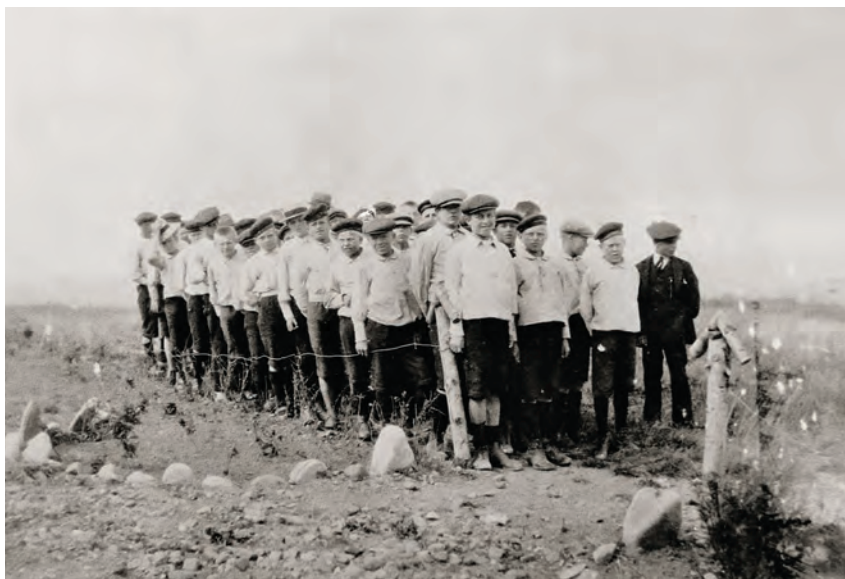
Omkring fyrrerens klædte Godhavnsdrengene fotograferet, dengang Godhavn var en opdragelsesanstalt. Fotograf ukendt, ca. 1920.

dag og blev regnet for forstandernes officielle talerør over for offentlighed og myndigheder. 7 Især i undersøgelsesperiodens første årti fremførtes i pressen jævnligt kritik af forholdene på børnehjem, en kritik, som resulterede i, at flere børnehjem blev lukket, eller forstanderen/forstanderinden fyret. Samtidig førtes der en debat i Børnesagens Tidende, hvor forstandere gav svar på tiltale ved at fremføre idéer om børneopdragelse, som byggede på moderne pædagogik og teoretiske begreber fra pædagogikken og psykologien. 8