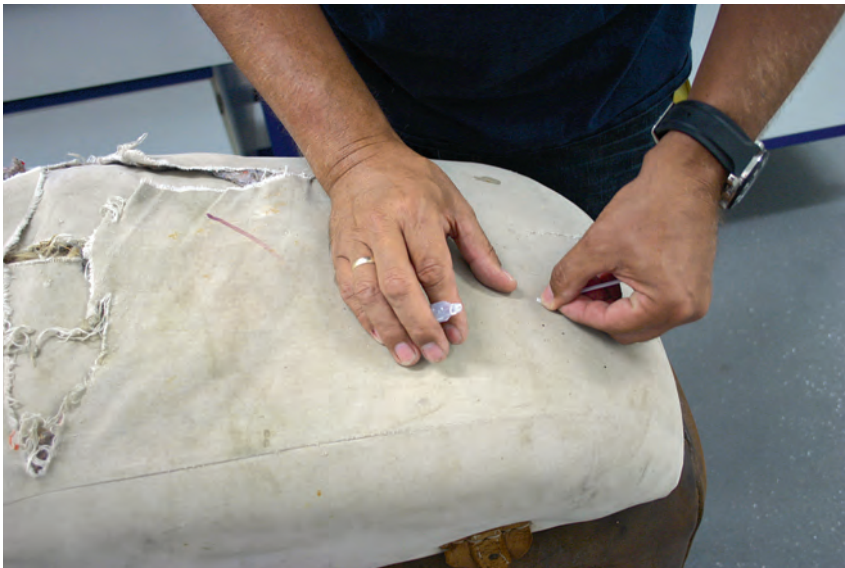
Hesten fra Værebros bliver underkastet en Combur-Test®, hvor de enkelte pletter bliver duppet med denatureret vand og derpå gnedet med en indikatorstik, som slår ud med grønt, når der er blod.

Vi besluttede at undersøge, om der kunne påvises spor af blod på hesten, skønt der var gået mere end 50 år, siden afstraffelserne fandt sted. En kontakt til Svendborg Politis Funktionsledelse udvirkede, at Kriminalteknisk afdeling i Fredericia, det tidligere Rejseholdets Tekniske Afdeling, blev sat på opgaven. Hesten blev bragt til Fredericia, hvor den blev analyseret for rester af blod ved fire teknikker: