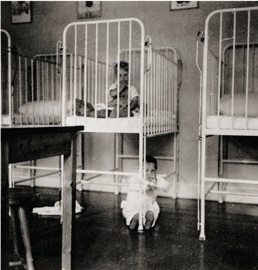
Undersøgelsen har ikke fundet billeder fra Norges Minde, men her ses en lignende sovestue på Kerteminde Spædbørnehjem. Foto: barneplejerske Inger Sune Nielsen, 1957.