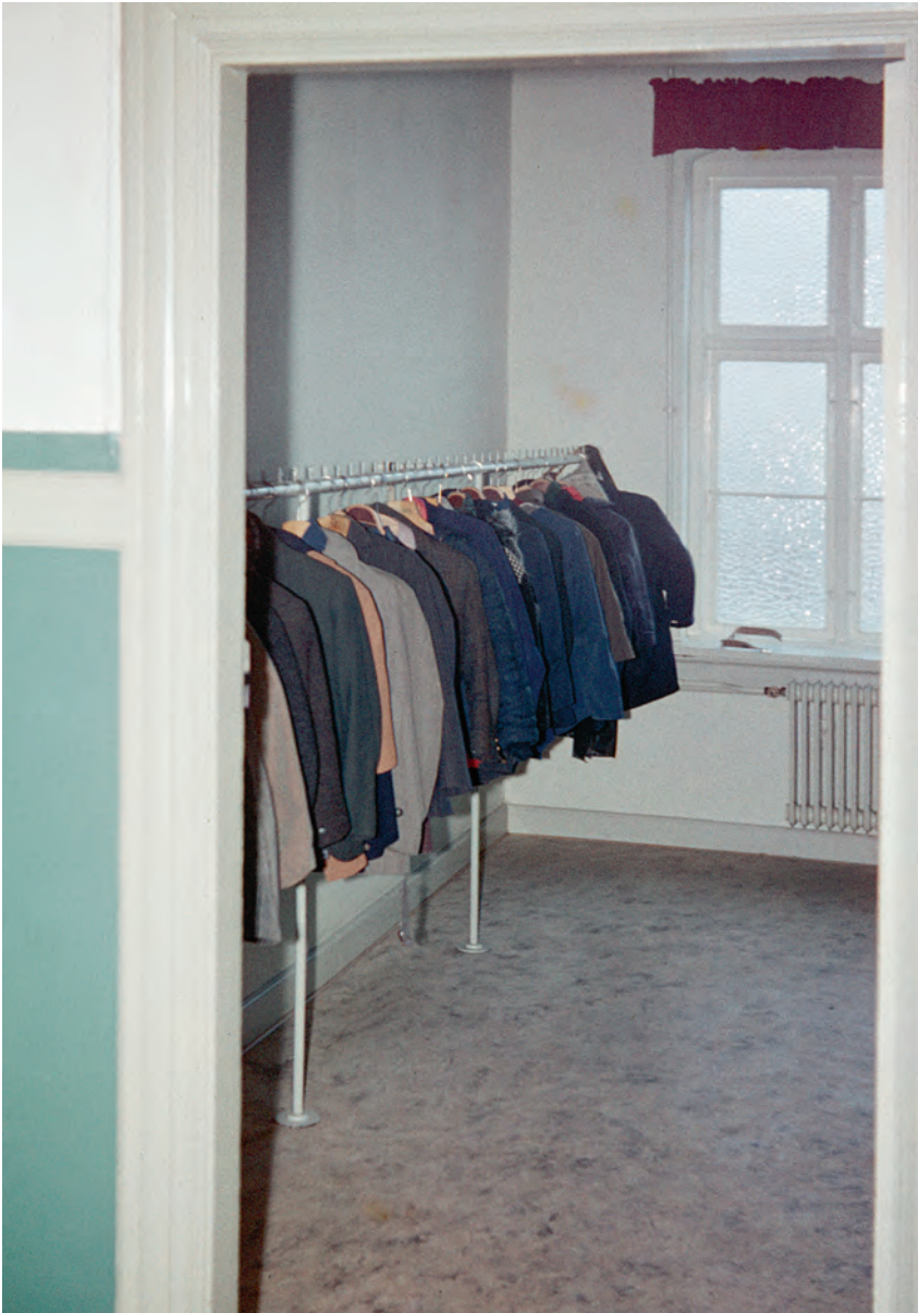
Drengjakker hænger på systuen. Drengene ejede intet personligt, fortæller lærer Henning Clausen, de havde kun det tøj, de gik og stod i. Ved indskrivning blev der syet numre i tøjet, som blev givet videre fra dreng til dreng, til det var slidt op. Foto: Henning Clausen 1968.