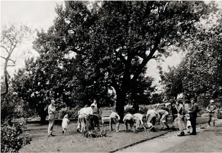
Drenge på Seden Enggård samler nedfaldsfrugt. Fotograf ukendt, ca. 1960.