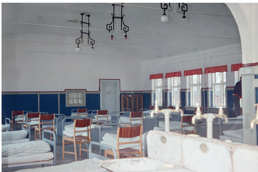
Sovesalen på Godhavn, set fra vaskerummet. Stolene er til at lægge og hænge drengenes tøj på. Bag vinduet i endevæg ved dør lå nattevagtens rum.